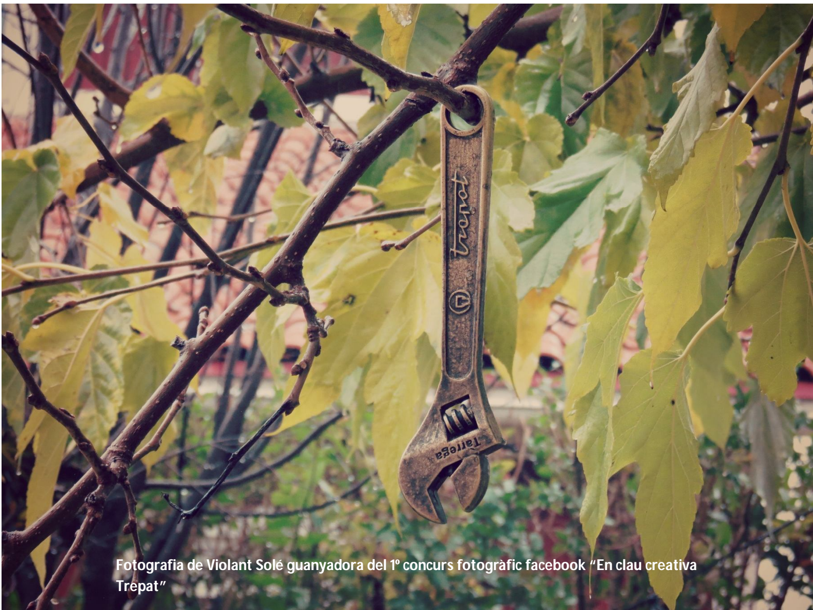
Fotografia de Violant Solé guanyadora del 1º concurs fotogràfic facebook "En clau creativa Trepat"